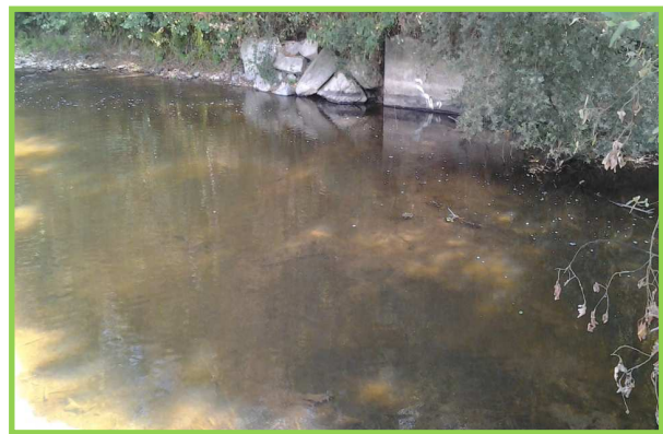
Les Roches : Suppression du clapet, protection de berges, restauration annexe hydraulique