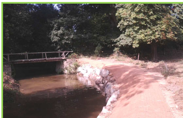
Protection de berges, Enrochement