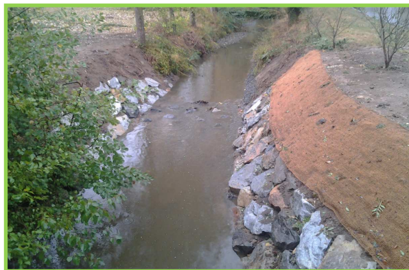
Suppression du clapet, Enrochement et protection des berges, Recharge en granulats