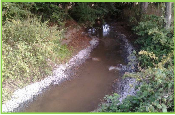
Talutage des berges, recharge en granulats