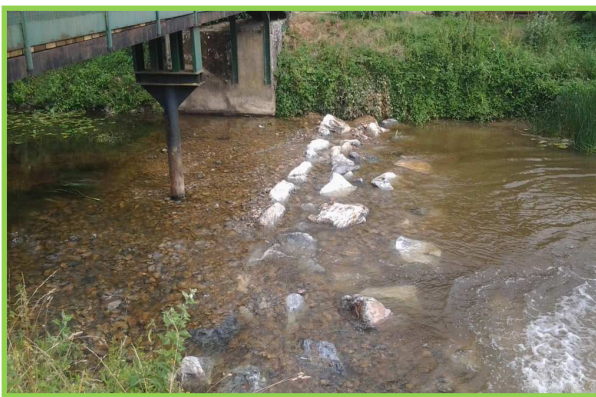
Grenusse : Suppression du clapet et recharge en aval