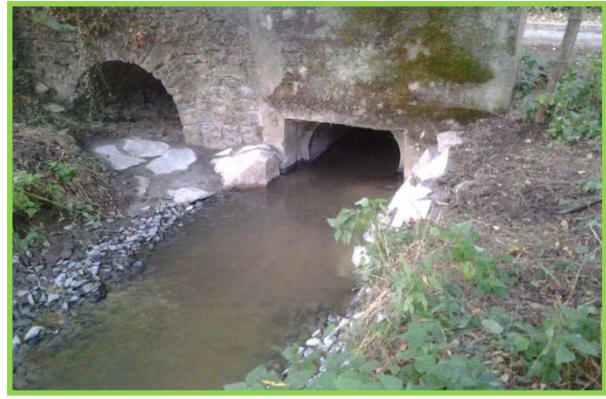
Confortement de pont